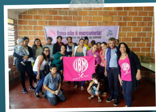
Sintaema e UBM juntos contra a privatização da Sabesp.