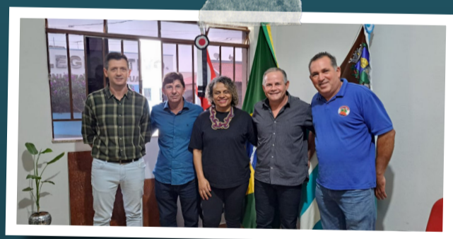
Prefeito de Taguaí (SP) apoia luta do Sintaema em defesa da Sabesp.