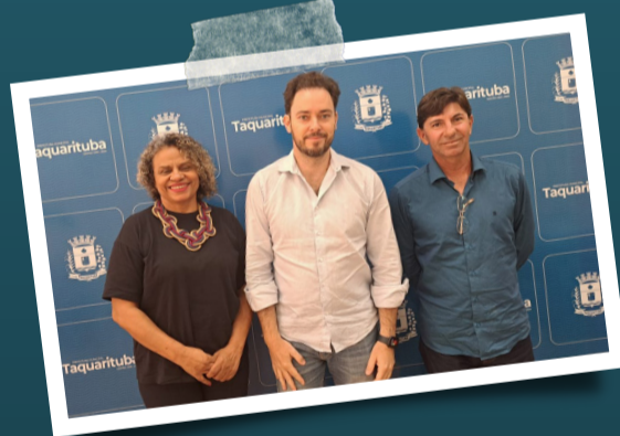
Prefeito de Taquarituba (SP) também apoia luta do Sintaema contra a privatização da Sabesp.