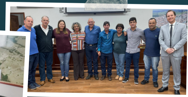
Audiência Pública em Itatinga (SP). Sintaema contra a privatização da Sabesp.