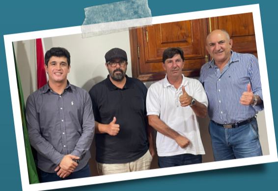
Prefeito de Itatinga (SP) apoia luta do Sintaema contra privatização da Sabesp.