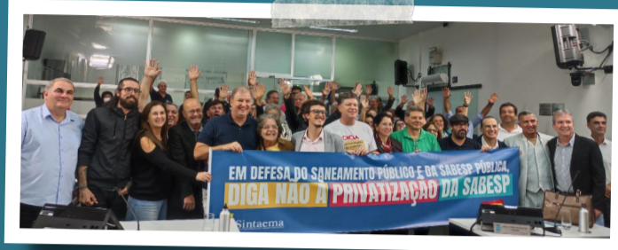
Audiência Pública em Botucatu. Juntos na luta em defesa da Sabesp.