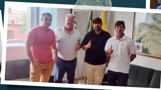
Prefeito de Porangaba (SP) apoia luta do Sintaema em defesa da Sabesp.