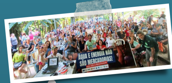
Movimento pelo Direito à Moradia diz não à privatização da Sabesp.