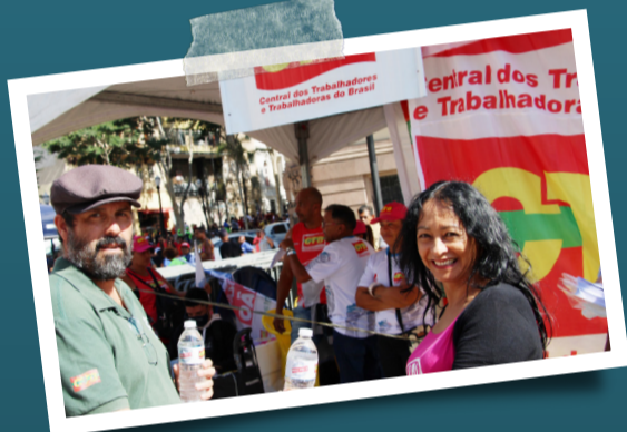
No 1º de Maio, Sintaema conversa com a população sobre ameaça de aumento da tarifa de água.