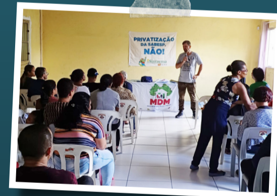
Sintaema e MDM (Movimento pelo Direito à Moradia) também estão juntos contra a privatização da Sabesp.