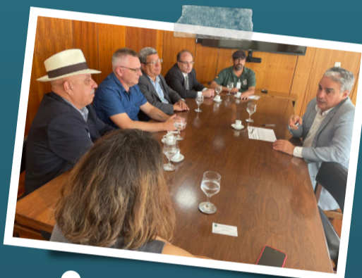
Sintaema em Brasília na luta pela criação da Frente Parlamentar Mista em defesa do Saneamento Público.