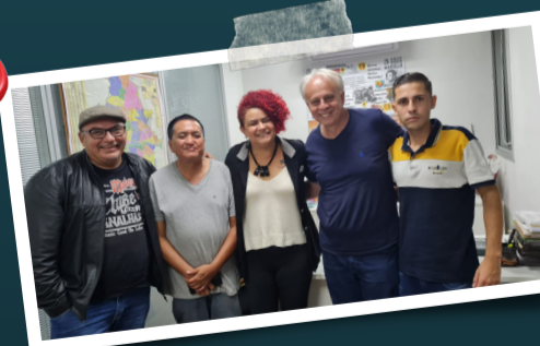
Sintaema em luta pela criação de uma Frente Parlamentar na Câmara de Osasco (SP).