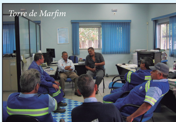
Torre de Marfim