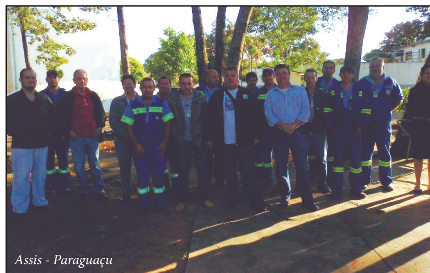
Assis - Paraguaçu