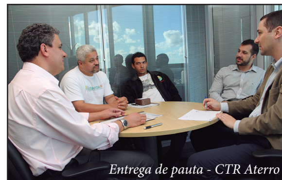
Entrega de pauta - CTR Aterro