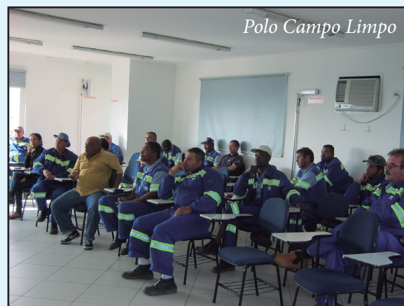
Polo Campo Limpo