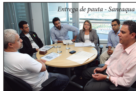
Entrega de pauta - Saneaqua