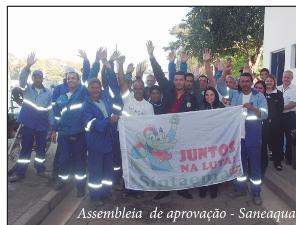
Assembleia de aprovação - Saneaqua