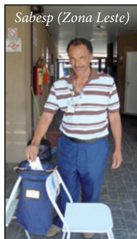
Sabesp (Zona Leste)