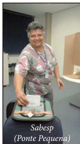
Sabesp (Ponte Pequena)