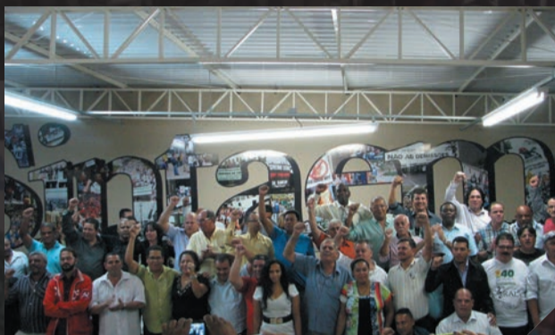
Posse da nova diretoria do Sintaema Fevereiro