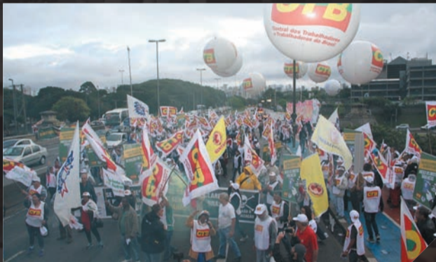
Ato contra as terceirizações Maio