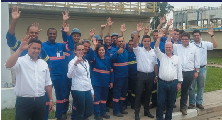
Trabalhadores da Ságua Guarulhos aprovam proposta em assembleia dia 13 de novembro

O sindicato permanecerá em negociação Para a assinatura de um aditivo, visando o pagamento de uma PLR, a ser medida a partir de janeiro de 2016.