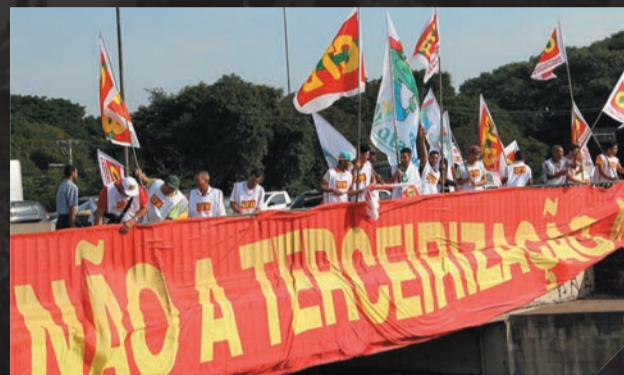
Protesto contra a terceirização Abril