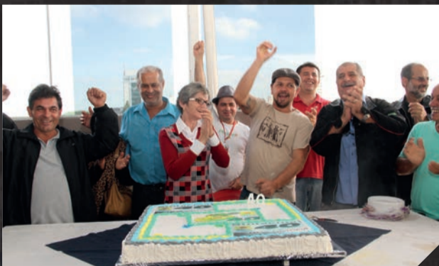
Encontro de delegados e Suplentes comemoram os 40 anos do Sintaema e lança o foto-livro da trajetória de lutas - Maio