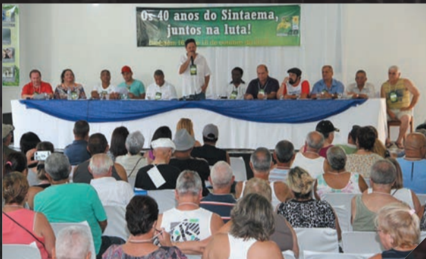
Aposentados - Seminário Outubro