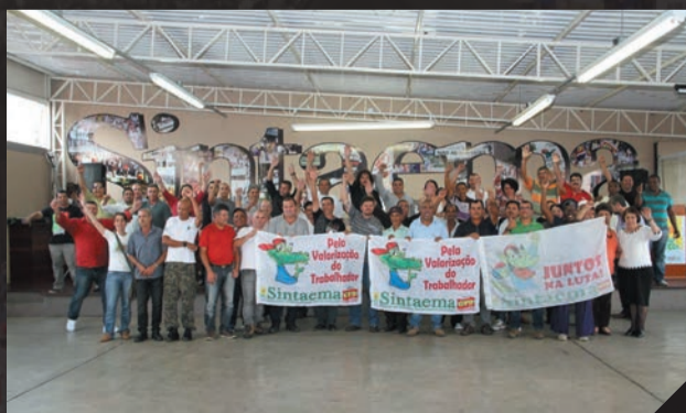
Fundação Florestal - Assembleia Campanha Salarial Outubro