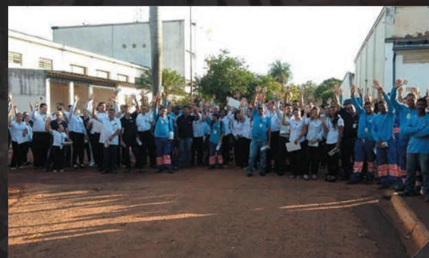
Samar - Campanha Salarial Novembro