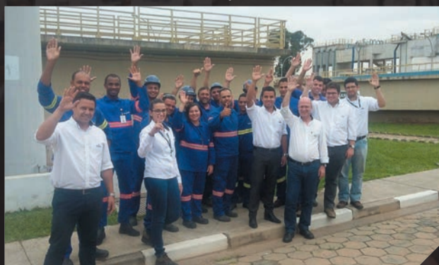
Sagua - Campanha Salarial Novembro