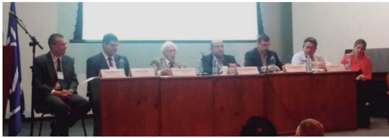
Por isso o Departamento de Saneamento e Meio Ambiente do Sintaema participou na USP do

A crise hídrica é um assunto que continua sendo debatido devido a sua gravidade, complexidade e impactos na vida da população