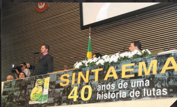
Homenagem ao Sintaema pelos 40 anos de luta Junho