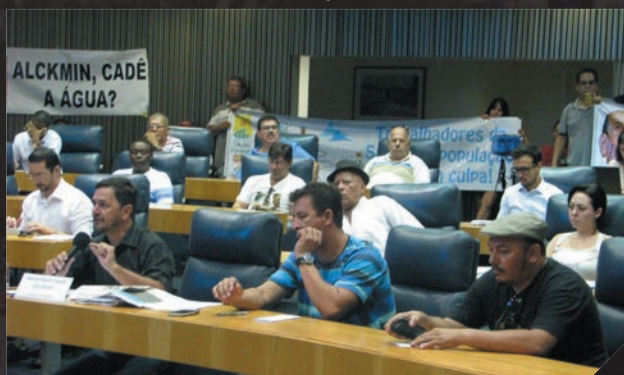
Sabesp - Audiência sobre a CPI na Sabesp Fevereiro