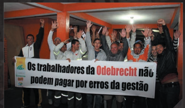
Odebrecht Ambiental - Protesto Abril