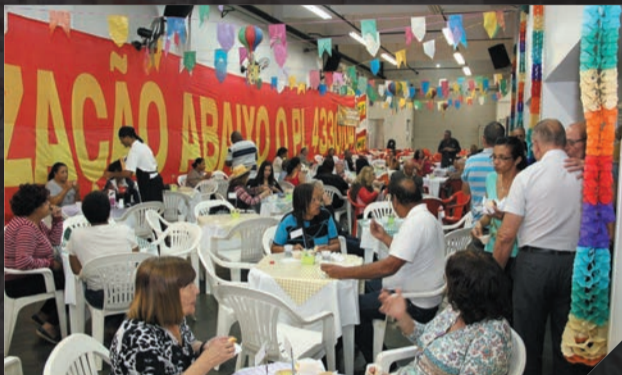
Aposentados - Arraial Julho

Confira os principais momentos da nossa categoria de luta!