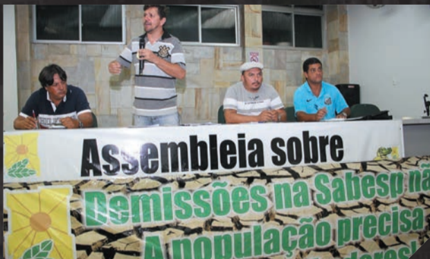
Sabesp - Assembleia sobre demissões Março