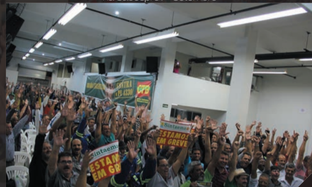
Sabesp - Assembleia pela PPR Abril