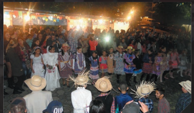
Festa Junina - Colônia Junho