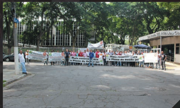
Sabesp - Ato pela Sabesp Novembro