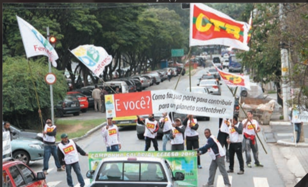
Cetesb- Protesto em alusão ao Dia Mundial do Meio Ambiente Junho