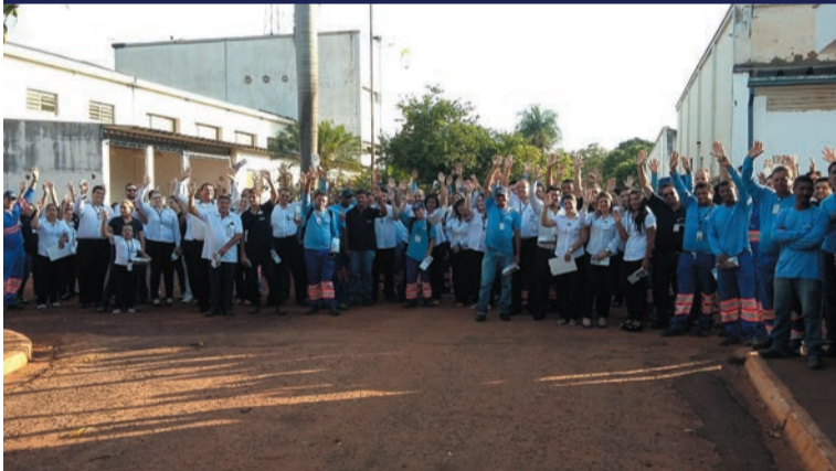
Em 16 de novembro, trabalhadores da Samar Araçatuba aprovam proposta

No dia 16 de novembro foi a vez dos companheiros e companheiras da Samar de Araçatuba que aprovaram em assembleia 9% de reajuste nos salários e a implantação de um Vale Alimentação no valor de R$ 80,00 a partir de novembro para todos os trabalhadores. Além do reajuste, o cartão de cesta básica é uma importante conquista dos trabalhadores.