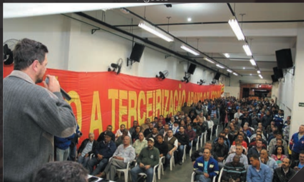
Sabesp - Assembleia Campanha Salarial Junho