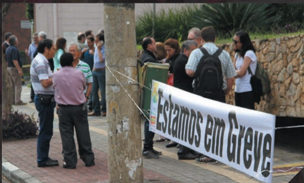
Cetesb- Trabalhadores entram em greve-Junho