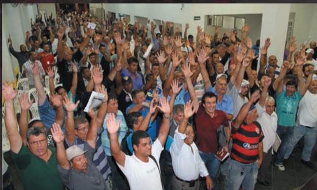
Sabesp - Assembleia sobre as demissões Março