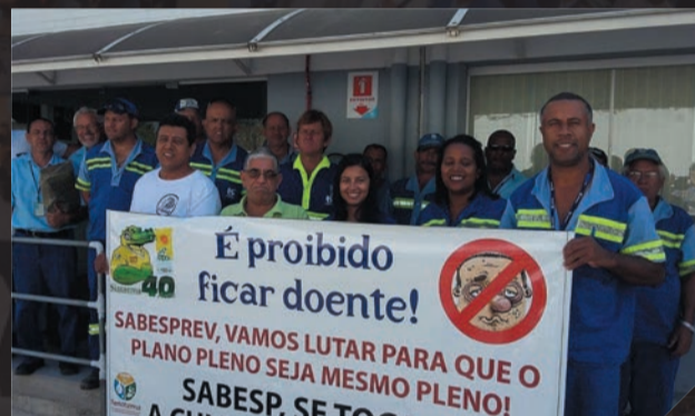
Sabesp - Trabalhadores de várias áreas protestam pelas mudanças na Sabesp - Setembro