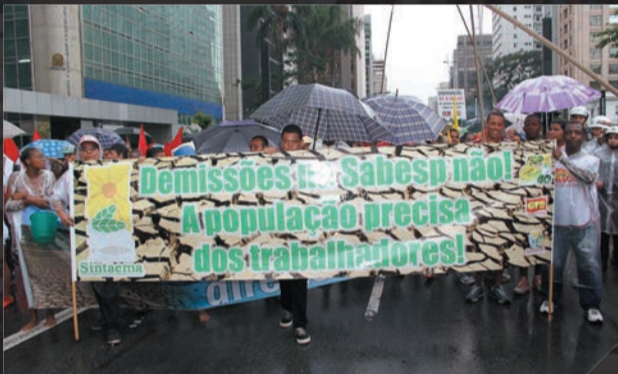
Ato contra demissões na Sabesp e contra a crise hídrica Março (1)