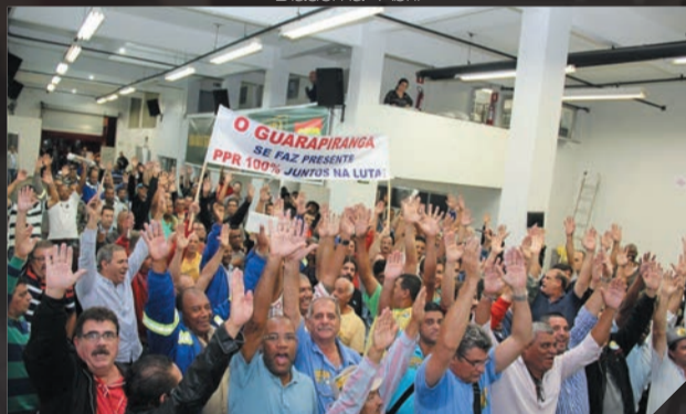
Sabesp - Assembleia pela PPR Maio