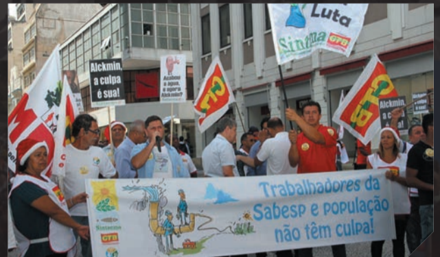
Ato contra Alckmin pela falta d'água Abril