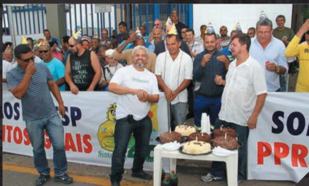
Sabesp - Protesto pelo pagamento da PPR aos trabalhadores de Diadema - Abril