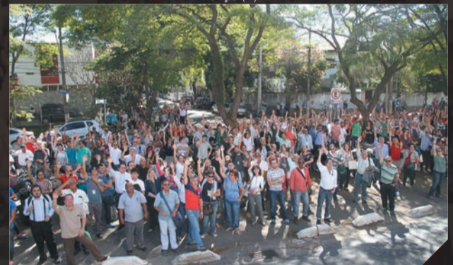
Cetesb- Trabalhadores encerram greve Junho