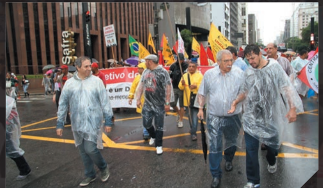
Ato contra demissões na Sabesp e contra a crise hídrica Março (2)