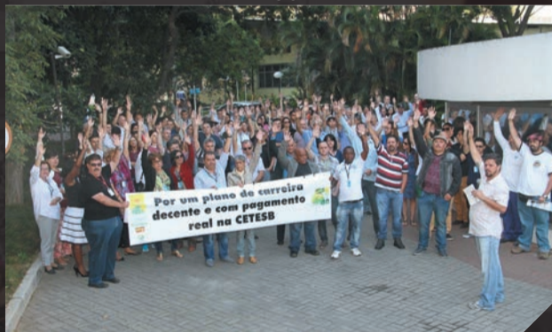
Cetesb- Assembleia sobre Plano de Carreira Agosto