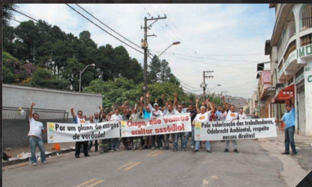
Odebrecht Ambiental - Protesto contra assédio Fevereiro

Confira os principais momentos da nossa categoria de luta!