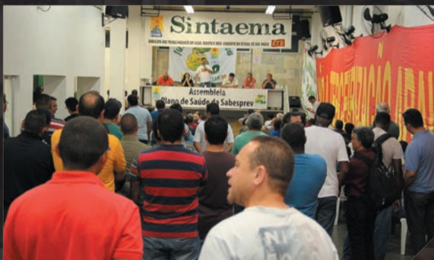
Sabesp - Assembleia em prol do Plano de Saúde Sabesp Agosto