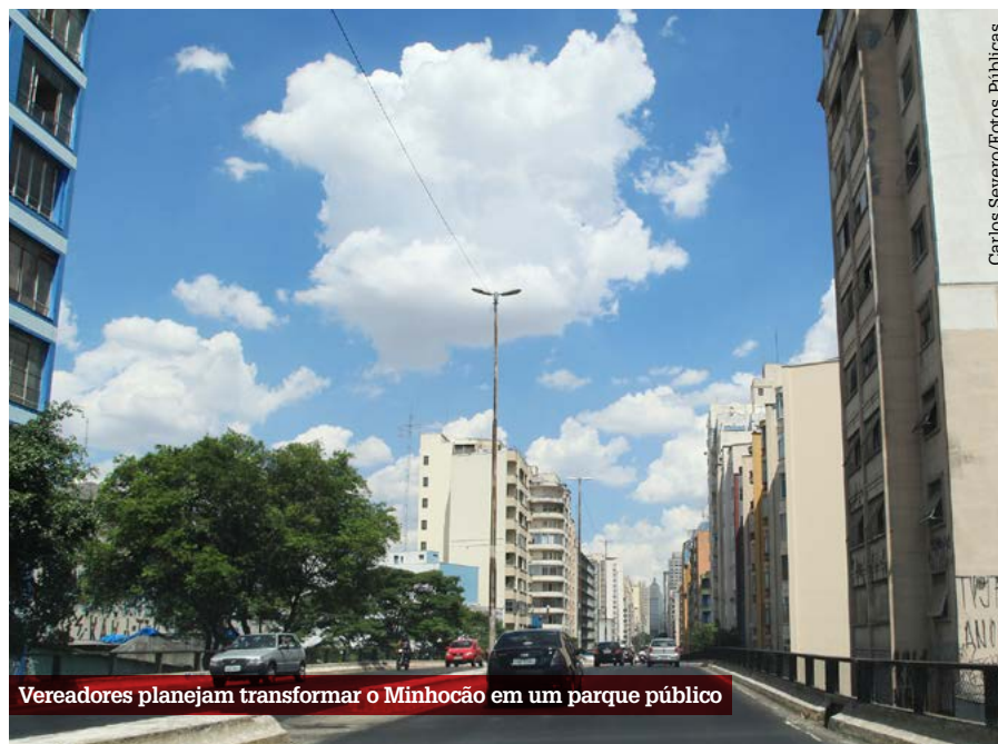
Vereadores planejam transformar o Minhocão em um parque público

Atualmente, o Minhocão é vetado à circulação de veículos motorizados aos domingos, feriados e das 21h30 às 6h durante a semana. Além de incluir o sábado, a proposta prevê antecipar o fechamento à