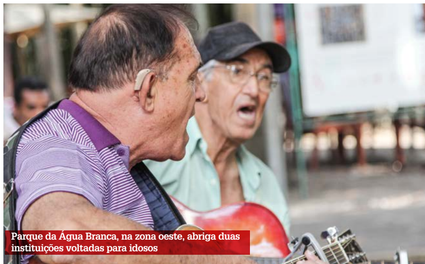
Parque da Água Branca, na zona oeste, abriga duas instituições voltadas para idosos

cas também são ótimas opções. A partir do dia 17, a USP abre inscrições para o Programa Universidade Aberta para a Terceira Idade. Há vagas em cursos de artes, saúde, engenharia, educação e psicologia, dentre muitos outros. (MD)