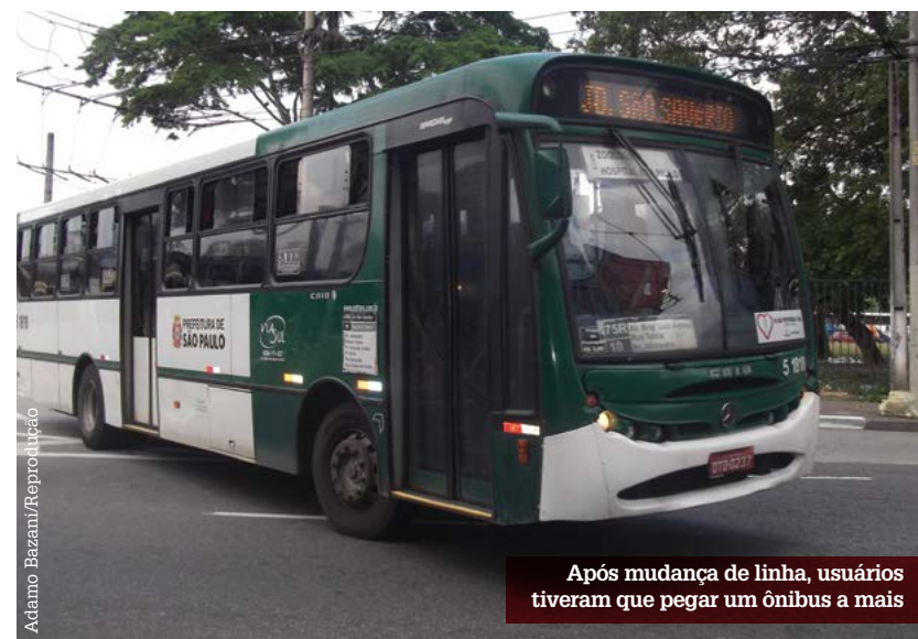
Após mudança de linha, usuários tiveram que pegar um ônibus a mais

Segundo o último Censo, a Vila Gomes é o segundo local da cidade com mais idosos. Segundo o IBGE, pouco mais de 10 mil idosos vivem no distrito do Butantã.