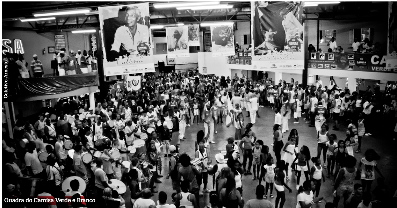
Quadra do Camisa Verde e Branco

Muitos dos que frequentavam o bairro moravam do outro lado do Rio Tietê, e assim ajudaram também a fortalecer o samba na zona norte