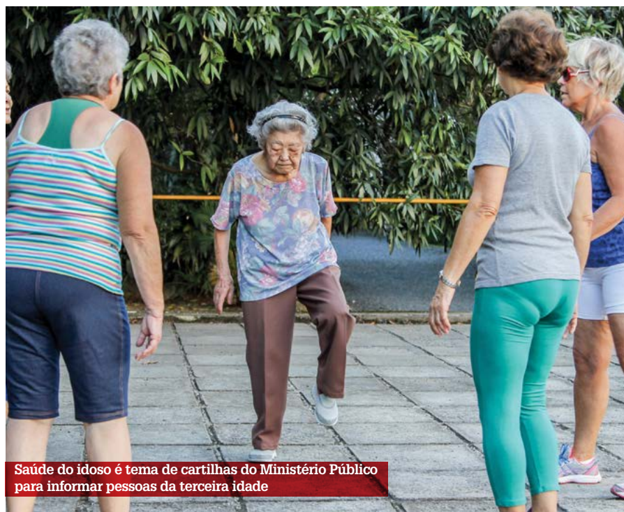
Saúde do idoso é tema de cartilhas do Ministério Público para informar pessoas da terceira idade

As cartilhas Saúde Cidadão podem ser encontradas no site do Ministério Público de São Paulo ( bit.ly/MqrYCn ). Elas também são distribuídas pelo órgão e pela Secretaria de Saúde do município.