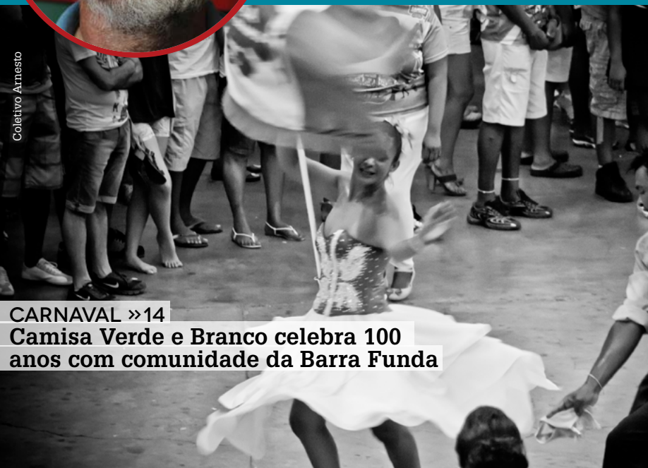
CARNAVAL »14 Camisa Verde e Branco celebra 100 anos com comunidade da Barra Funda