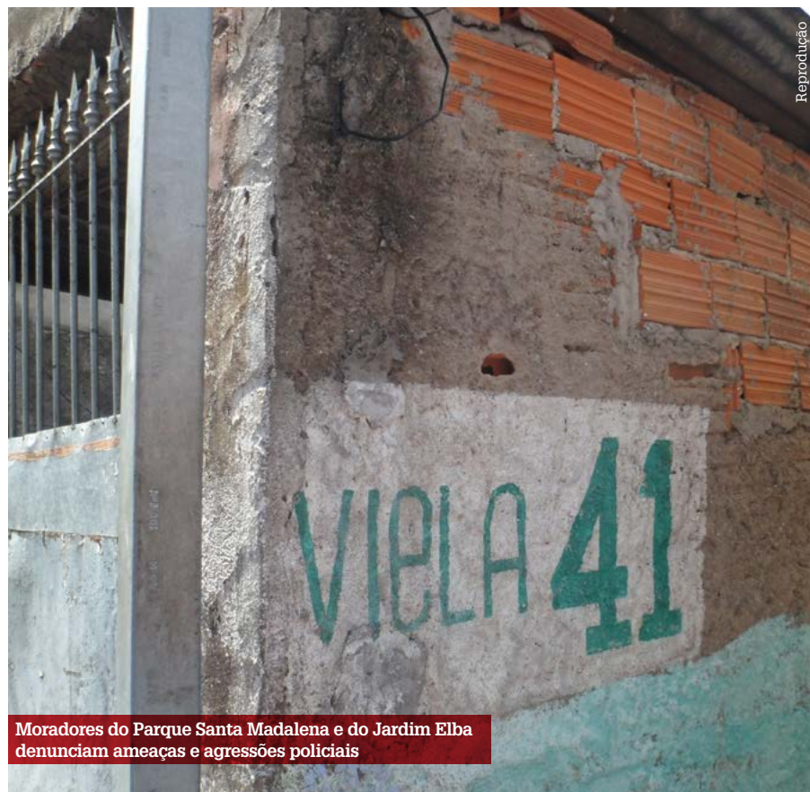
Moradores do Parque Santa Madalena e do Jardim Elba denunciam ameaças e agressões policiais

Entre 10 e 15 de janeiro, motoqueiros não identificados passaram atirando na Praça Moleque Travesso (Jardim Planalto), Rua Mucambos e