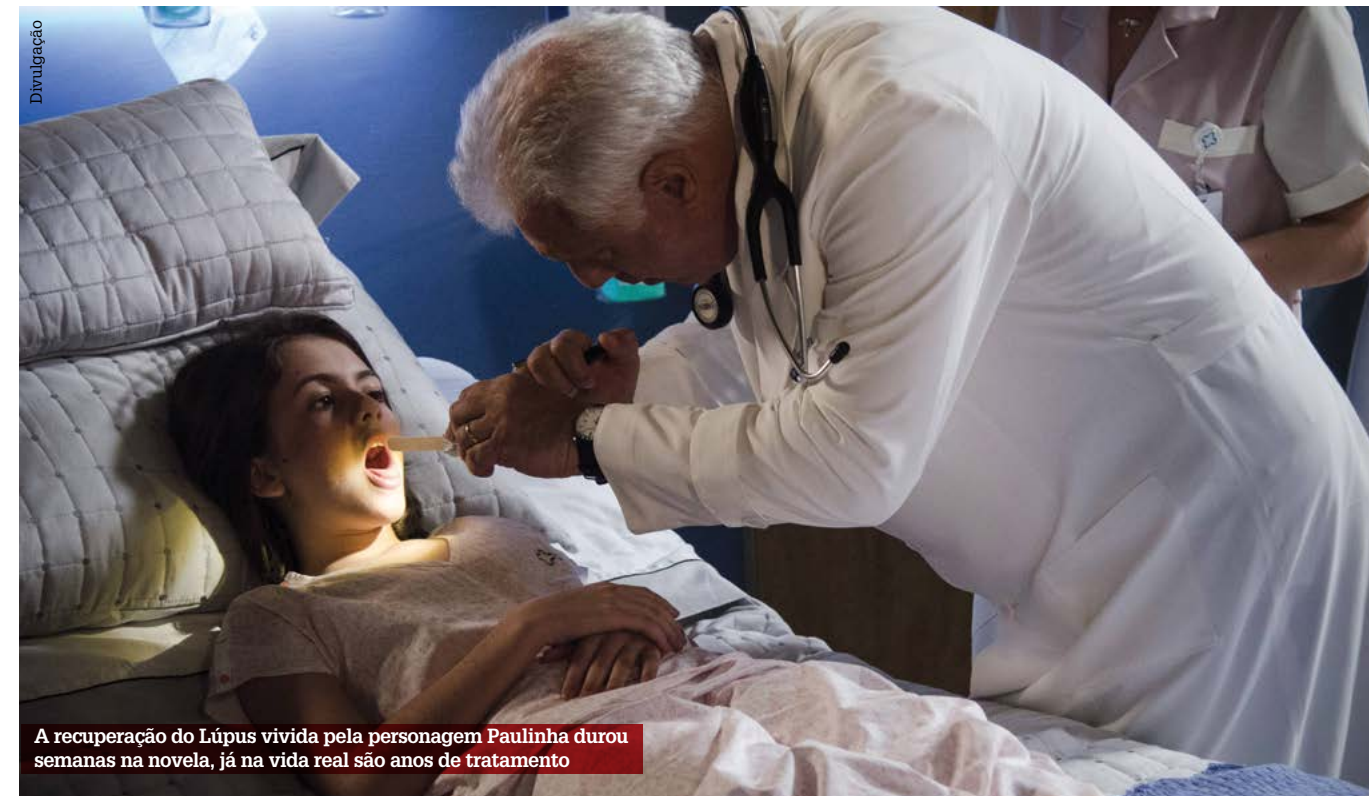
A recuperação do Lúpus vivida pela personagem Paulinha durou semanas na novela, já na vida real são anos de tratamento