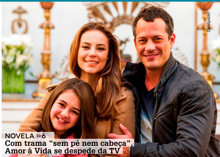
NOVELA »6 Com trama “sem pé nem cabeça”, Amor à Vida se despede da TV