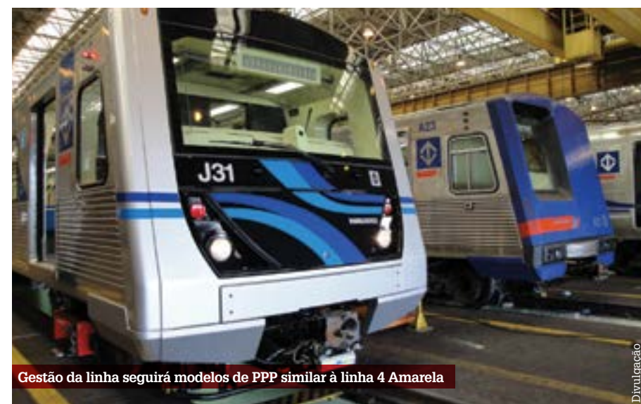
Gestão da linha seguirá modelos de PPP similar à linha 4 Amarela

TRANSPORTE 300 MIL PASSAGEIROS USARÃO TRECHO POR DIA; PREVISÃO DE ENTREGA FINAL É DE QUATRO ANOS