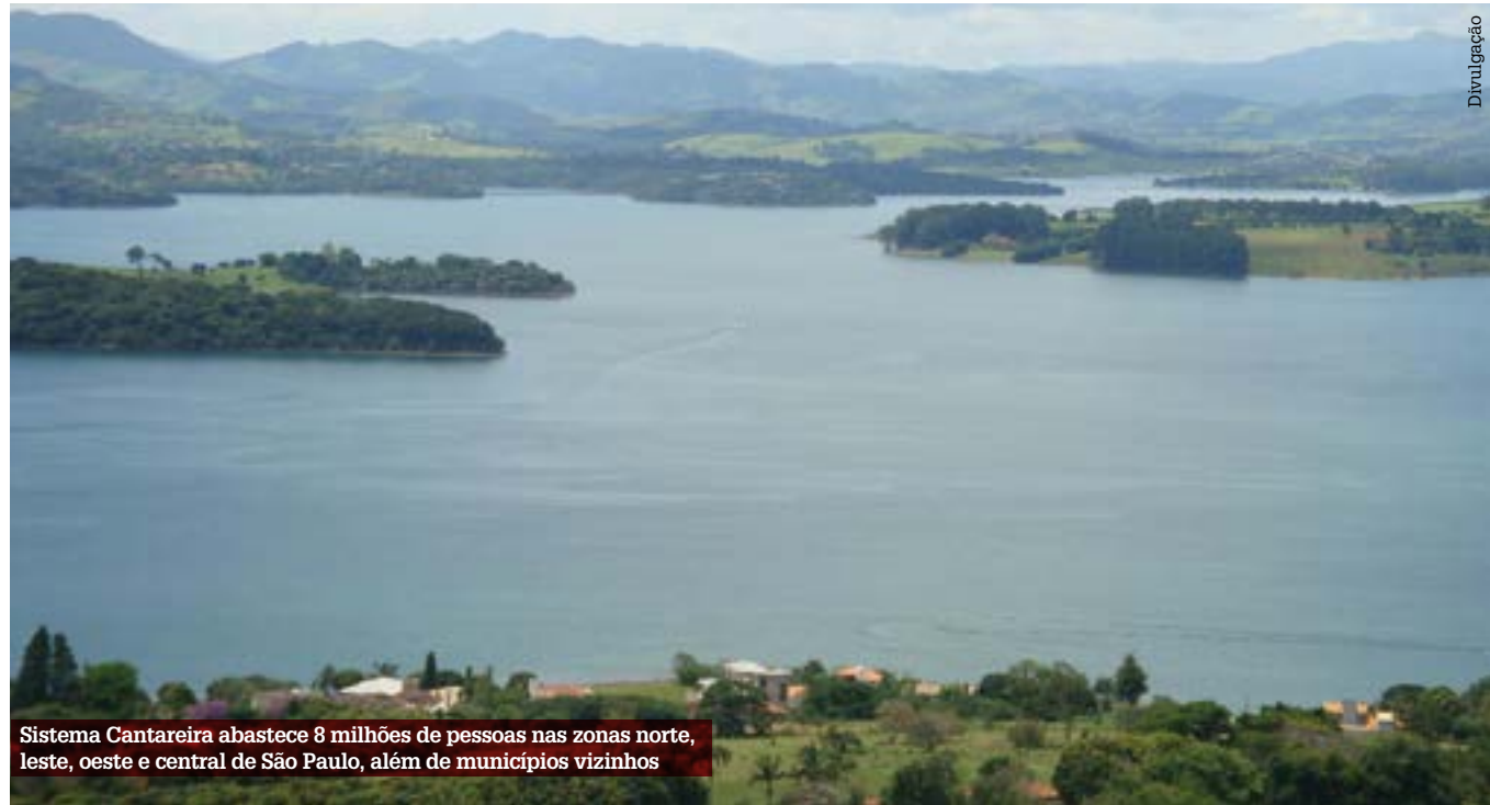
Sistema Cantareira abastece 8 milhões de pessoas nas zonas norte, leste, oeste e central de São Paulo, além de municípios vizinhos

Ele considera também que a Sabesp não faz os investimentos necessários no quadro de trabalhadores, priori-