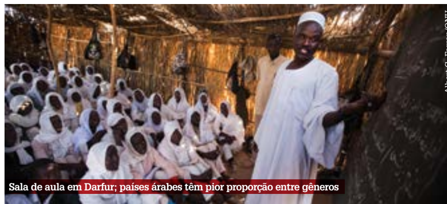
Sala de aula em Darfur; países árabes têm pior proporção entre gêneros

As meninas representam 54% da população mundial fora da escola. A situação é mais grave nos Estados árabes, onde essa proporção é 60% e não sofreu alterações desde 2000. O desequilíbrio que prejudica as matrículas de meninas nas escolas é maior nos países de baixa renda. Os dados estão no 11º Relatório de Monitoramento Global de Educação para Todos, divulgado pela Unesco (Organização das Nações Unidas para a Educação, a Ciência e a Cultura).