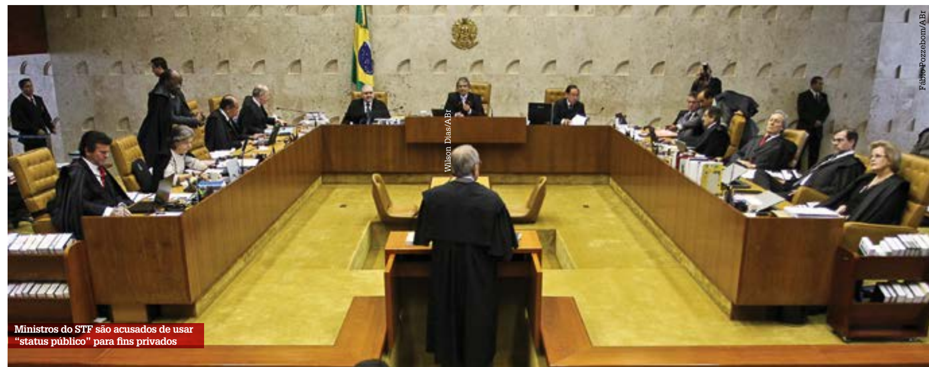
Ministros do STF são acusados de usar "status público" para fins privados