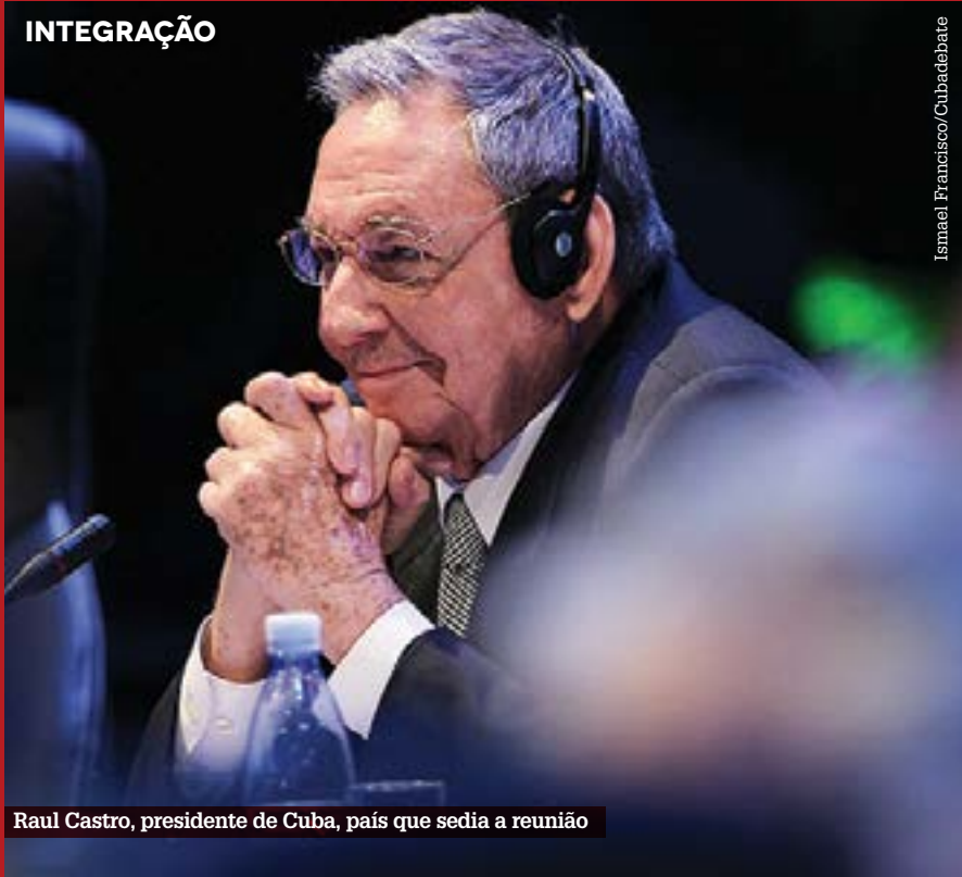
Raul Castro, presidente de Cuba, país que sedia a reunião

Cúpula da Comunidade de Estados Latino-americanos e Caribenhos, bloco político que contempla 33 americanos e exclui Estados Unidos e Canadá, se encontra pela segunda vez. Grupo foi idealizado por Chávez para colocar-se como uma alternativa aos atuais foros diplomáticos e consolidar uma agenda genuinamente latino-americana.