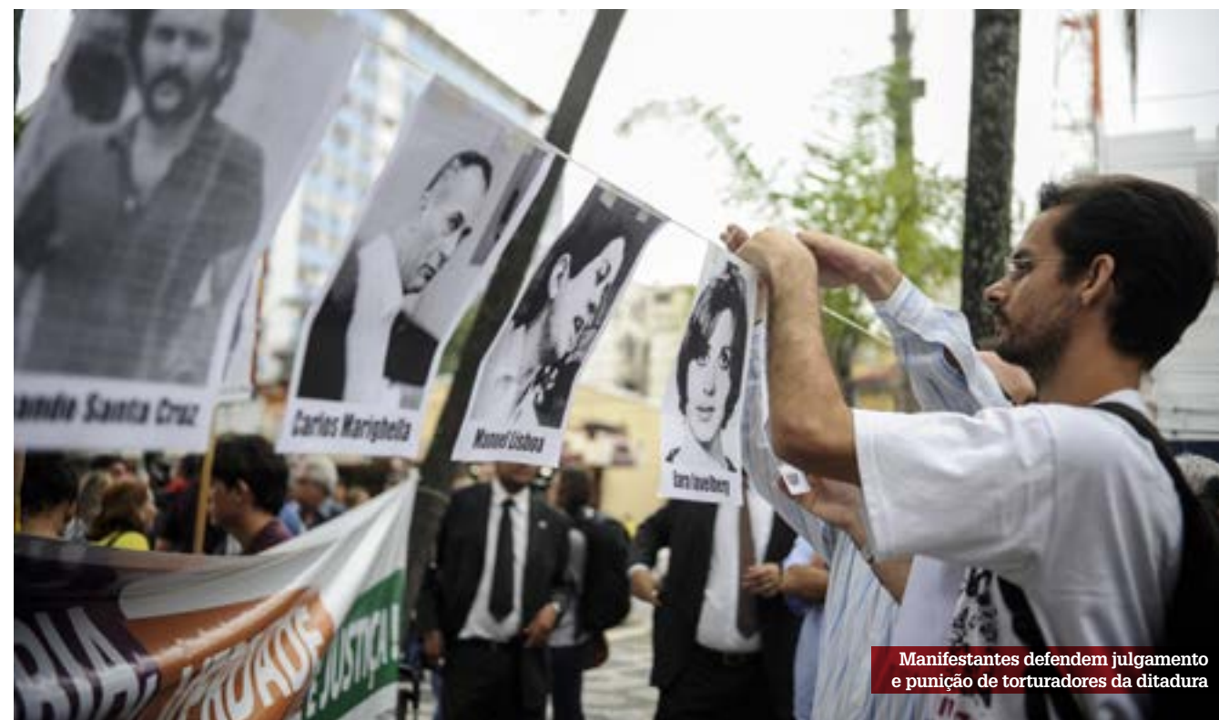
Manifestantes defendem julgamento e punição de torturadores da ditadura

*Jornalista e editor do blog www.rodrigovianna.com.br