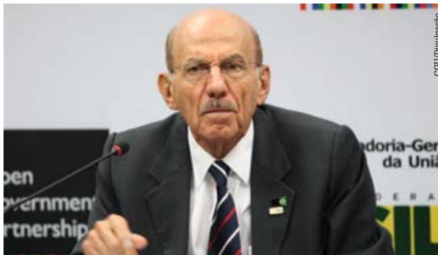
Jorge Hage, ministro-chefe da CGU: “O caráter principal dessa lei é o efeito preventivo da corrupção, mostrando que não vale a pena arriscar, que é melhor a empresa preparar-se para uma nova era de combate a esse tipo de ilícito”