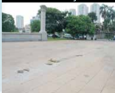
Ipiranga, Praça do Monumento

Com a requalificação dos bairros, através de obras de transformação de espaços urbanos, a Prefeitura está encontrando soluções articuladas para questões distintas como habitação, cultura, coesão social e mobilidade, melhorando muito a ocupação desses espaços.