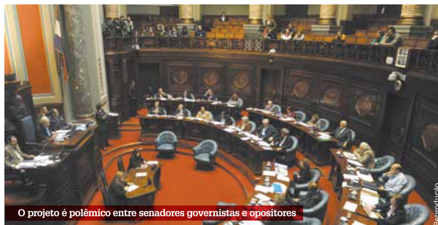
O projeto é polêmico entre senadores governistas e opositores

Os consumidores registrados poderão comprar maconha em farmácias especialmente habilitadas, até um máximo de 40 gramas por mês, ou cultivar em casa até seis plantas que produzam não mais de 480 gramas por colheita. ( Opera Mundi )