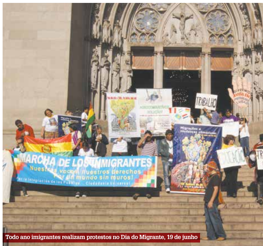
Todo ano imigrantes realizam protestos no Dia do Migrante, 19 de junho

O vereador petista criticou a maneira com que os jornais estão tratando o caso. “Mas e os corruptores? Onde estão aqueles que se beneficiaram de sonegar R$ 500 milhões? Sumiram das matérias de jornais, do rádio e da TV. Cadê seus nomes?”, questionou.