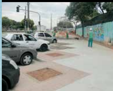
Freguesia do Ó, EMEF Dr. Elias de S. Cavalcanti

Recuperar calçadas e escadarias públicas para circulação, e devolver a elas a função de espaço de convívio social é um dos desafios das grandes cidades. A Prefeitura de São Paulo não só está fazendo isso, como tem desenvolvido modernos projetos de acessibilidade.