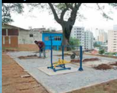
Vila Prudente, Praça Gonçalo da Fonseca

Recuperar praças e outras áreas públicas da cidade significa melhorar a qualidade de vida das pessoas. Afinal, a praça é um lugar de lazer, de saúde, de troca de ideias, de vida social. Por isso, ampliar e zelar por estas áreas é uma das prioridades da Prefeitura.