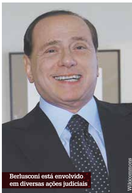
Berlusconi está envolvido em diversas ações judiciais

Berlusconi foi condenado a quatro anos de prisão por fraude fiscal em negócios de seu conglomerado de mídia, o Mediaset. Ele também está envolvido em outras ações judiciais. Em junho, foi condenado em primeira instância a sete anos de prisão por abuso de poder e prostituição juvenil.