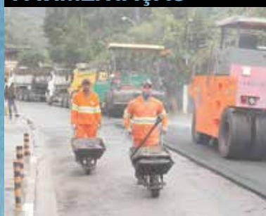
Parelheiros, Rua Humberto Ravello

A Prefeitura também está cuidando da pavimentação de ruas e avenidas em toda a cidade. Na maioria das vezes, trocando todo o asfalto, reformando guias e construindo calçadas. O objetivo é sempre o mesmo: facilitar a vida do cidadão e aumentar a segurança dos usuários das nossas vias.