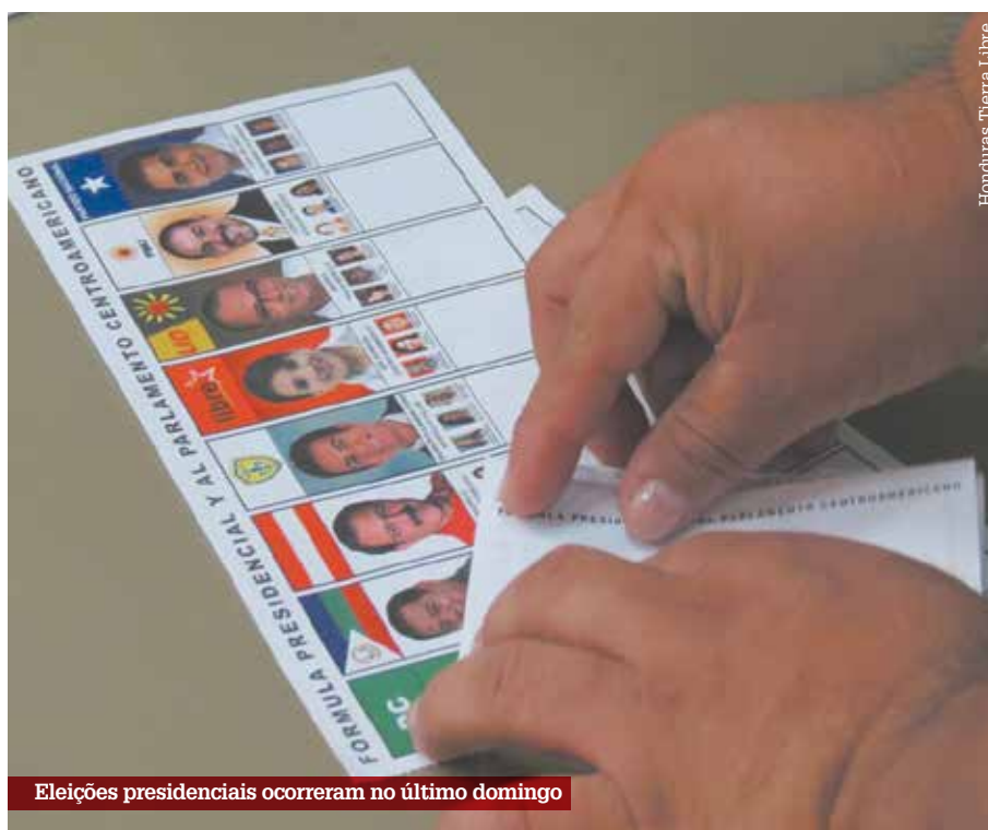
Eleições presidenciais ocorreram no último domingo

“Houve uma campanha suja aqui. Mantemos a posição de que o povo me elegeu. Roubaram o triunfo do povo hondurenho. O que está acontecendo é definitivo: estamos em uma ditadura”, afirmou Xiomara em entrevista a uma rádio local. ( Opera Mundi )