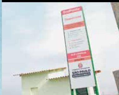
São Miguel, Rua Domitila D'Abril

Além disso, investimentos estão sendo feitos para tornar a cidade de São Paulo mais sustentável. E para isso foram criados os Ecopontos, locais de entrega voluntária de pequenos volumes de entulho, reduzindo assim o descarte irregular de móveis e outros resíduos recicláveis nas ruas, praças e córregos.