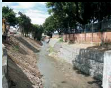
Vila Maria, Córrego Maria Paula

Para prevenir alagamentos e enchentes, a Prefeitura também desengavetou vários projetos de drenagem que vão eliminar pontos críticos da cidade. Com uma série de obras de melhoria, o controle das águas pluviais da cidade está definitivamente na mira das subprefeituras.