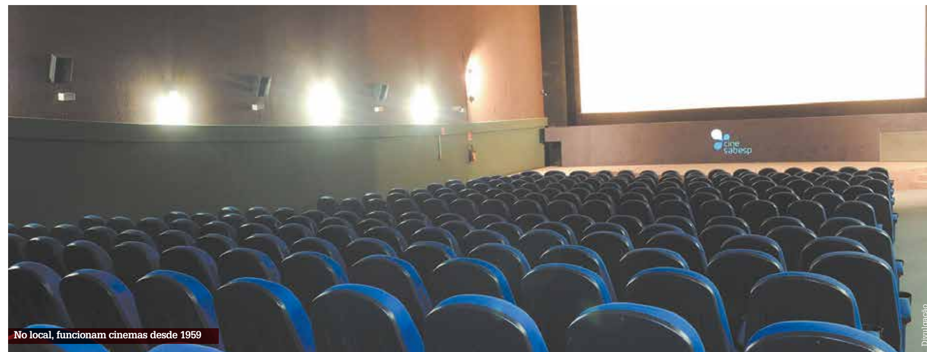
No local, funcionam cinemas desde 1959

ALTERNATIVO COM UMA ÚNICA SALA, O CINEMA É PONTO DE LAZER E ENCONTRO DE APOSENTADOS E VIZINHANÇA