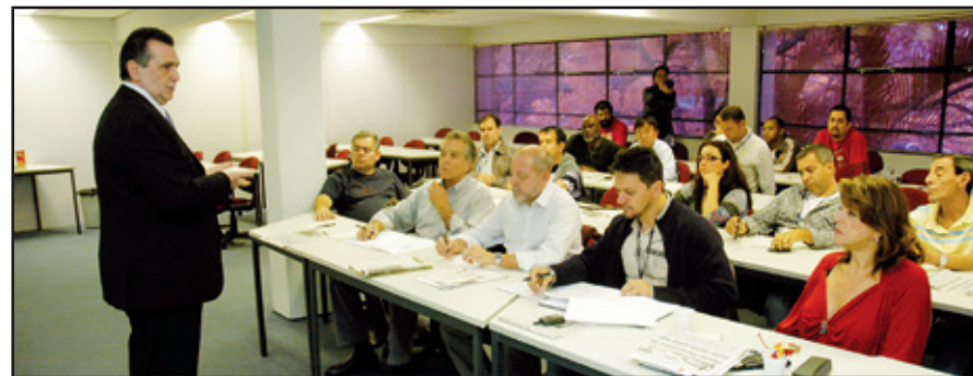
Reunião de apresentação das propostas, que ainda precisam de aprovação do Codec

Saneamento e por fim ao Codec. Se aprovadas, a implantação se dará apenas em 2011.