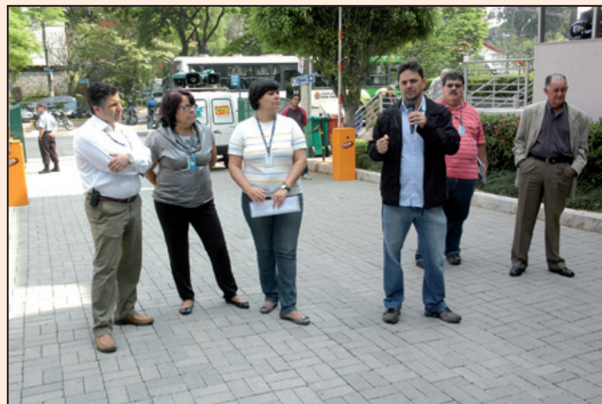
Sintaema enfatizou a indignação pela decisão unilateral da empresa

grupo dos trabalhadores, um dos itens do acordo, sem discutir com as entidades e muito menos com os trabalhadores que optaram pelo plano, e que só souberam da atitude unilateral depois do fato consumado, conforme informamos na última edição do jornal.