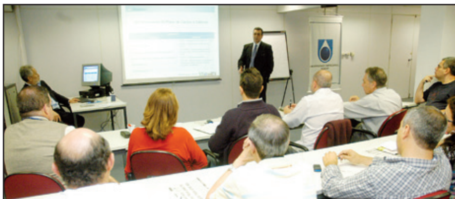
Melhorias apresentadas são fruto da luta das entidades

Essas propostas ainda serão levadas para aprovação da diretoria colegiada e superintendentes, depois levadas à Secretaria de