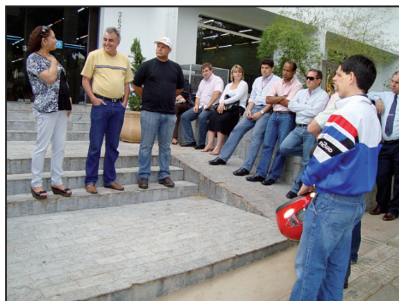
Presidente Prudente: superintendência e Polo