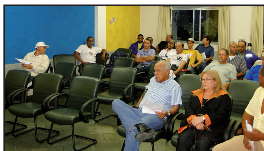
Trabalhadores da manobra da Sabesp MO se reuniram no dia 17 no Sintaema, onde foram abordadas e deliberadas questões importantes, como insalubridade e escala de revezamento, entre outras.